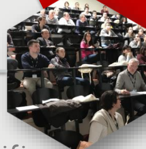
Table Ronde avec Thermo Fisher Scientific